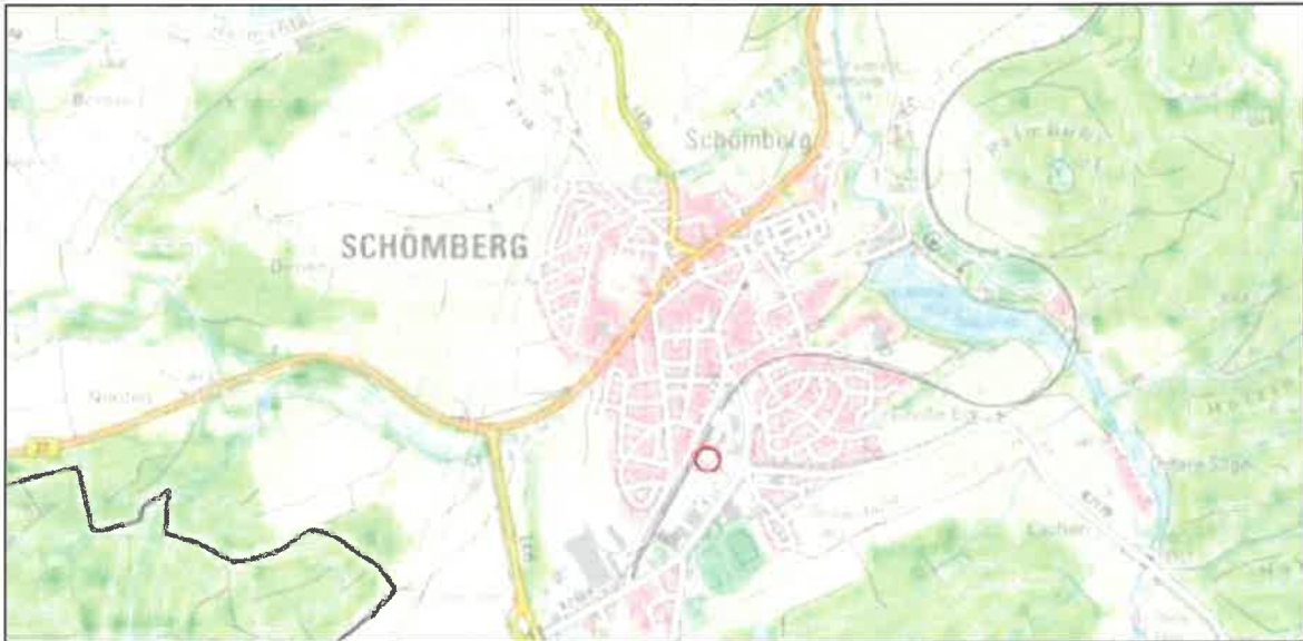
Abbildung 1: Übersichtslageplan des Plangebietes (rote Umrandung), unmaßstäblich

In der nachfolgenden Abbildung ist die Lage des Plangebietes dargestellt.