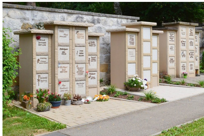
Foto Bsp. Urnenwandstelen