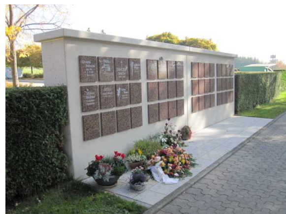
Foto Bsp. Urnenwand