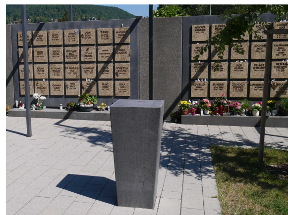
Foto Bsp. Urnenstele